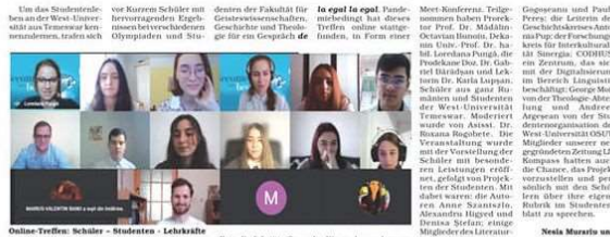
Online-Treffen: Schüler – Studenten – Lehrkräfte